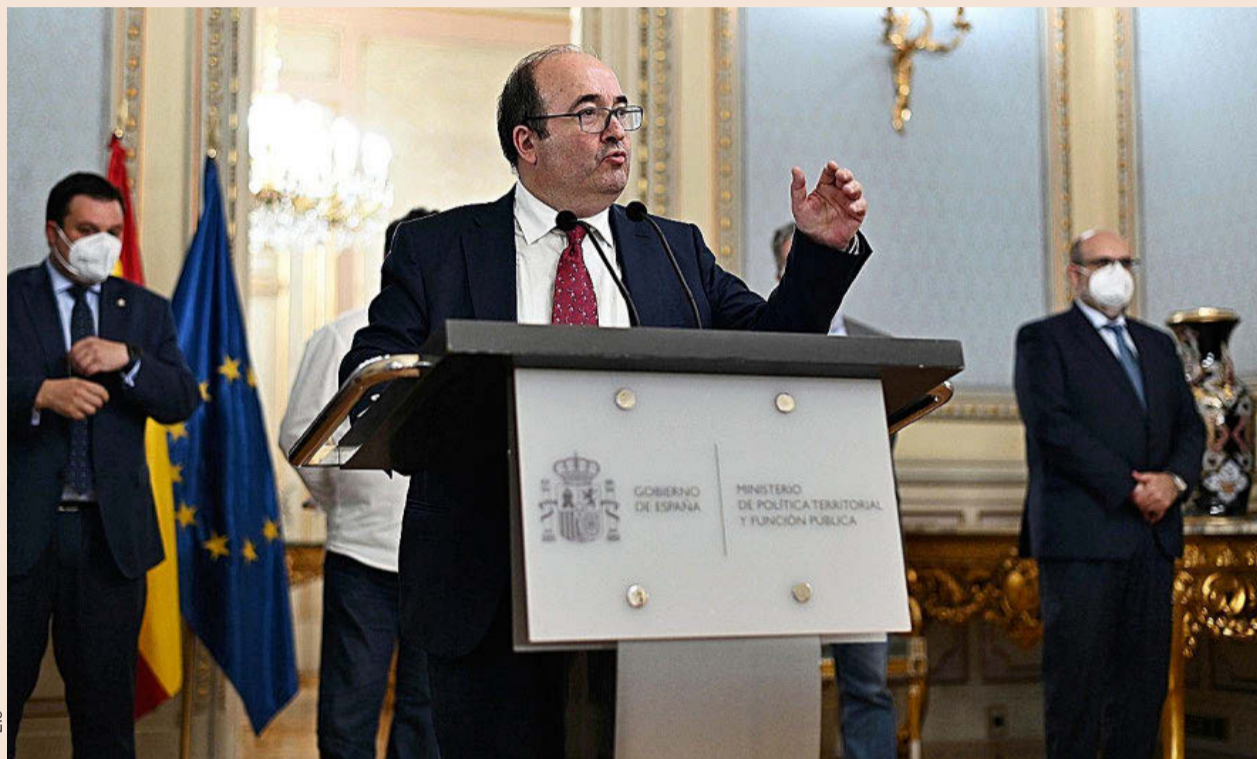
El ministro de Política Territorial y Función Pública, Miquel Iceta, ayer, en la presentación del acuerdo.

• Los suspendidos formarán parte de la bolsa de trabajo. El Gobierno ha previsto que los interinos que no superen las pruebas, puedan formar parte de una bolsa de trabajo nueva o ya formada. Eso sí, siempre que hayan obtenido la puntuación necesaria prevista para ello por la administración correspondiente. Al formar parte de la bolsa de trabajo, la Administración